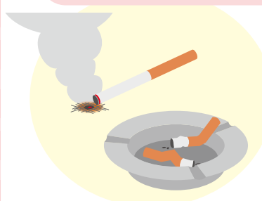
タバコの火の不始末