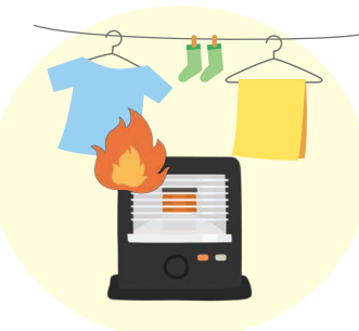
ストーブ使用時の注意