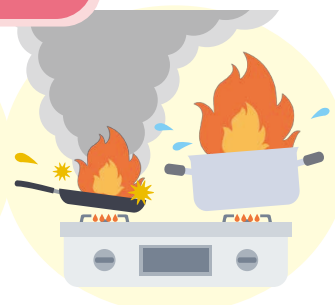
コンロ使用時の注意